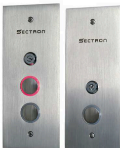
1 ou 2 Botões + Chave Bombeiro