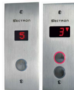
1 ou 2 Botões + IPD